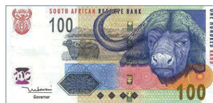
100 Rand Banknote aus Südafrika